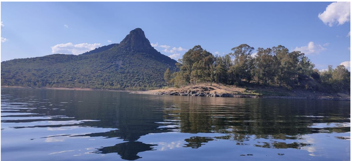
El castro, visto desde el agua.