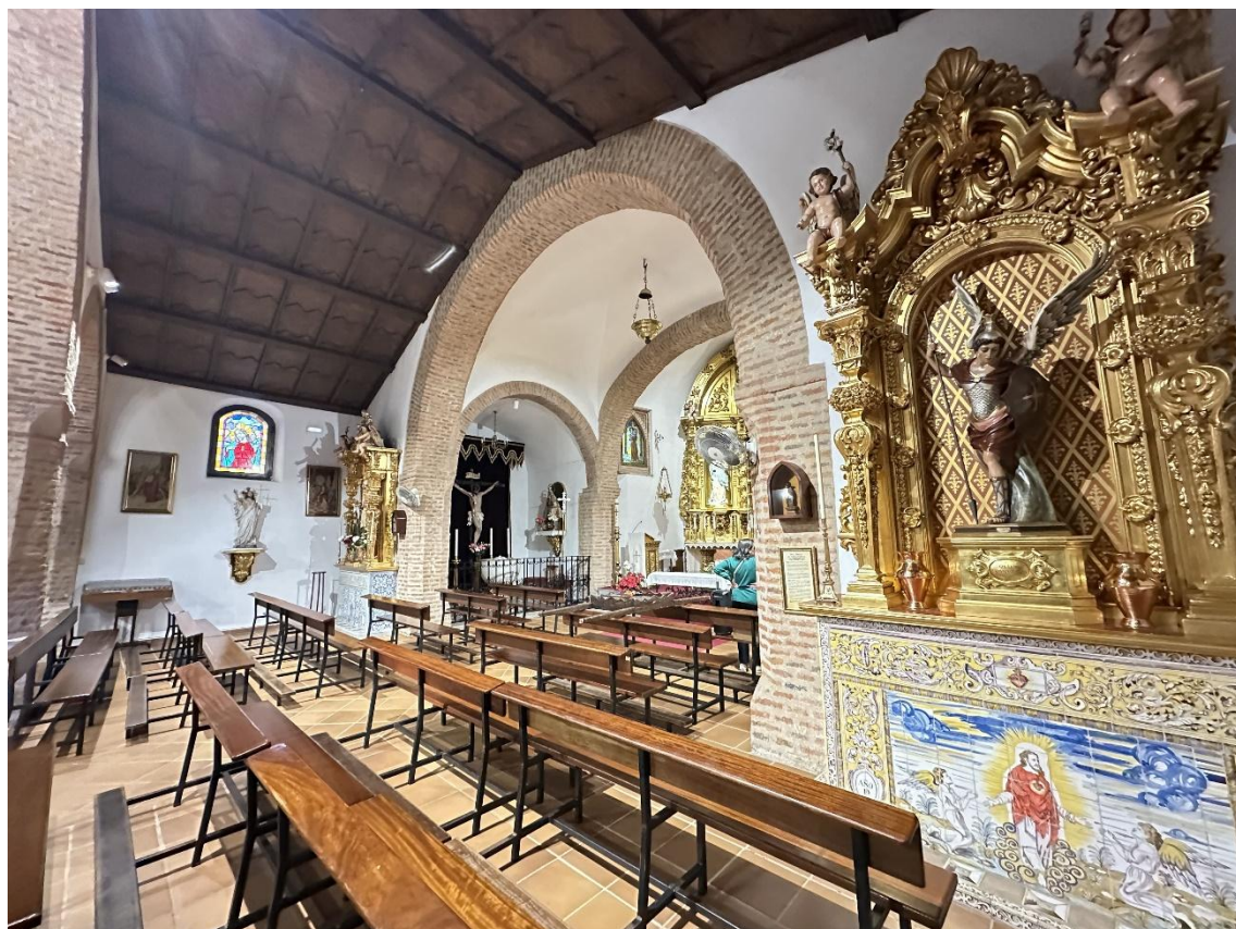
En el interior del templo se conservan diversos elementos de interés patrimonial y devocional.