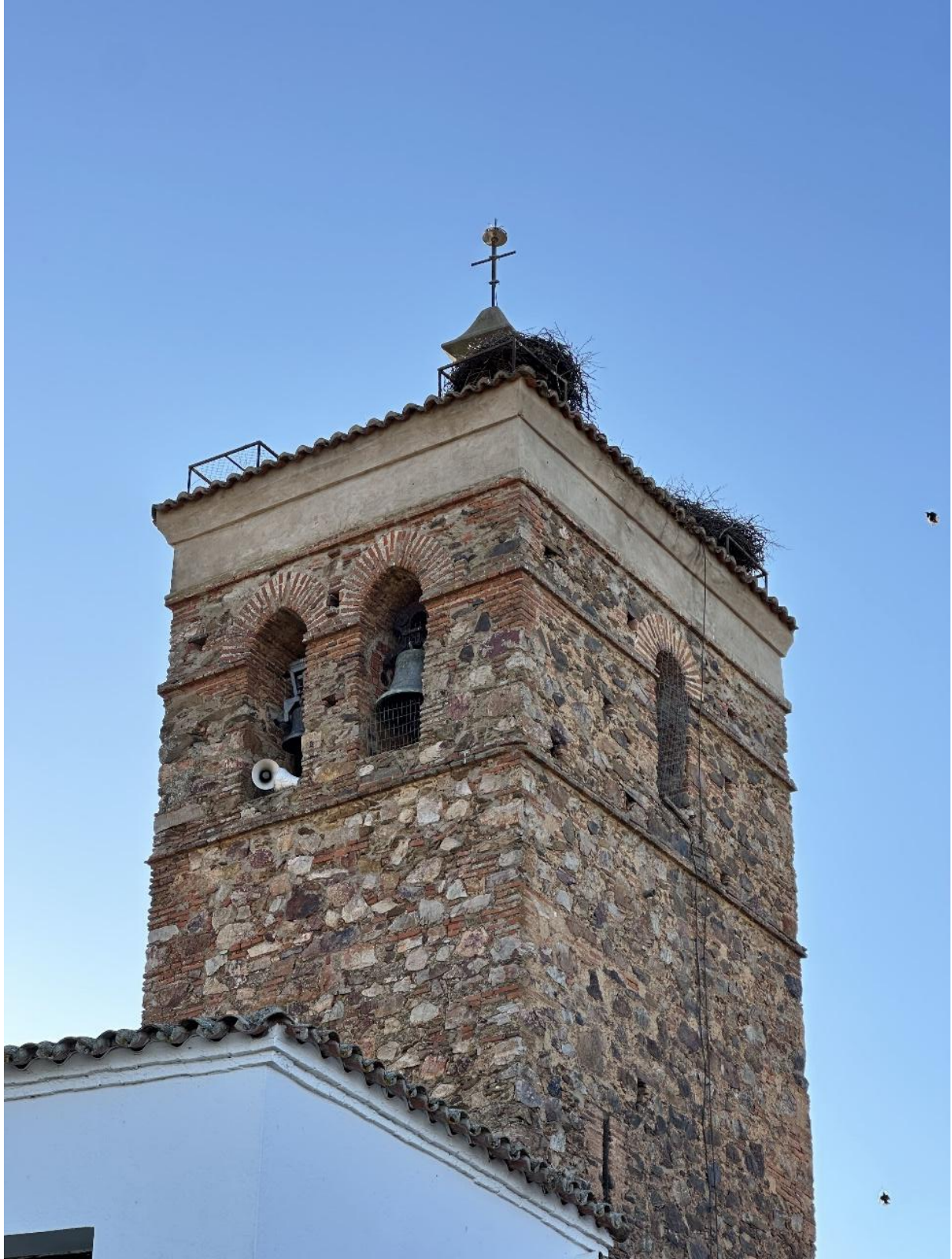
Detalle de la torre, construida a base de piedra y ladrillo.