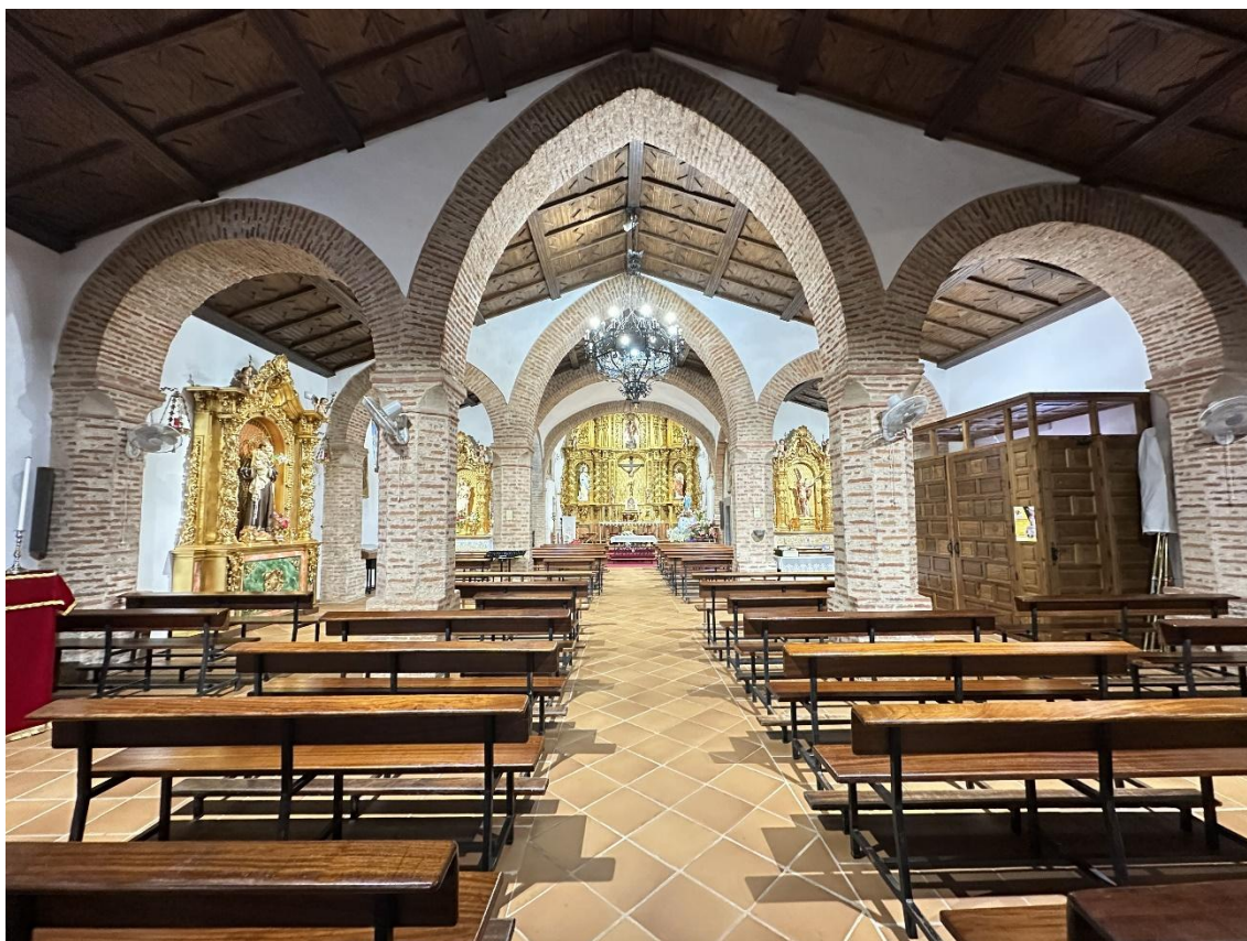
La iglesia presenta planta basilical de tres naves separadas por gruesos pilares y muros de mampostería.