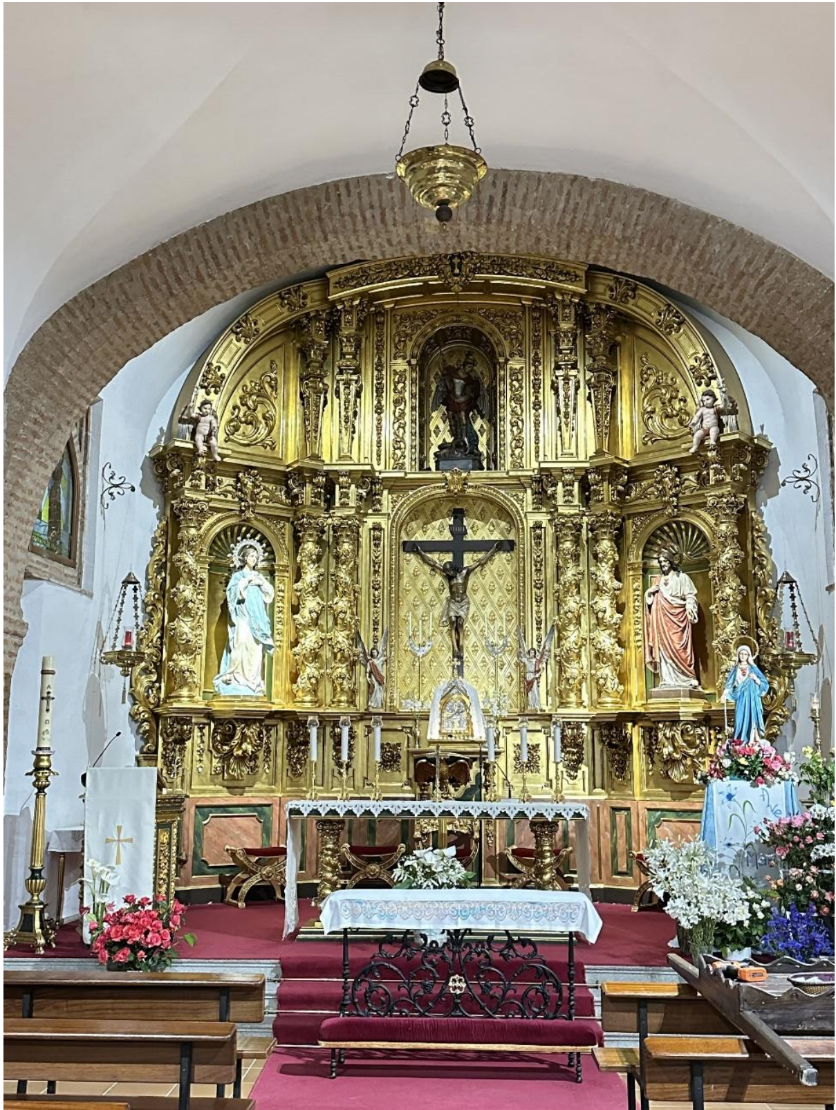
Detalle del retablo del templo.