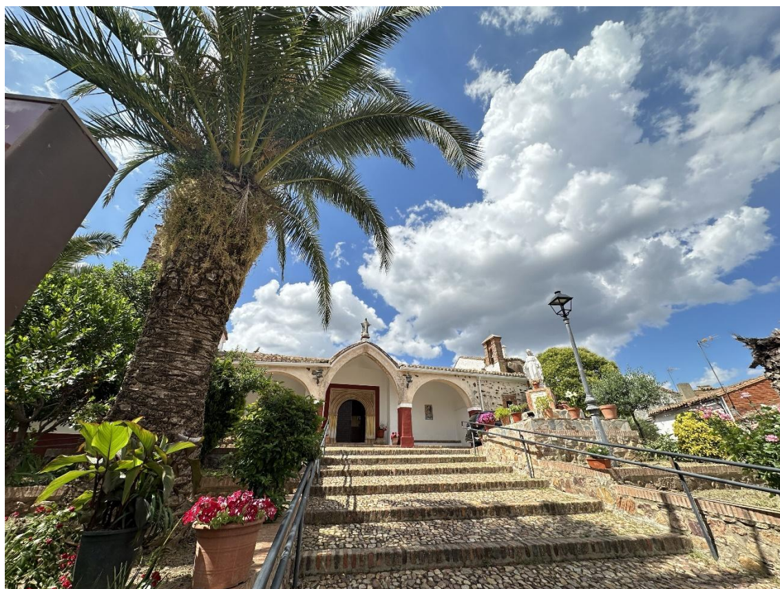
Imagen exterior de la Iglesia.