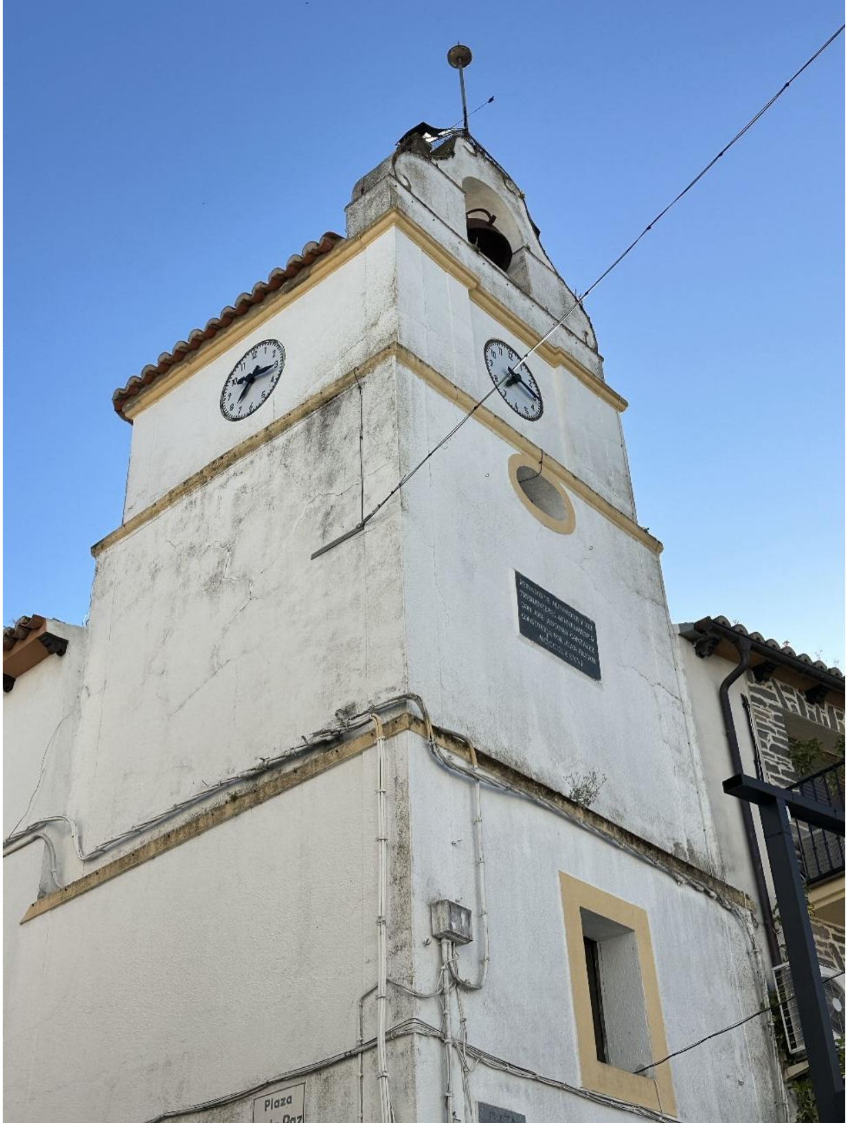
Torre en la que se aprecian un reloj frontal y otro en la pared lateral.