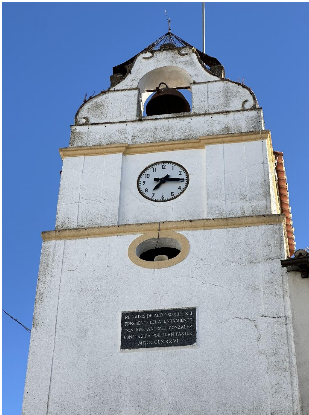
Inscripción en la pared frontal de "El Reloj".