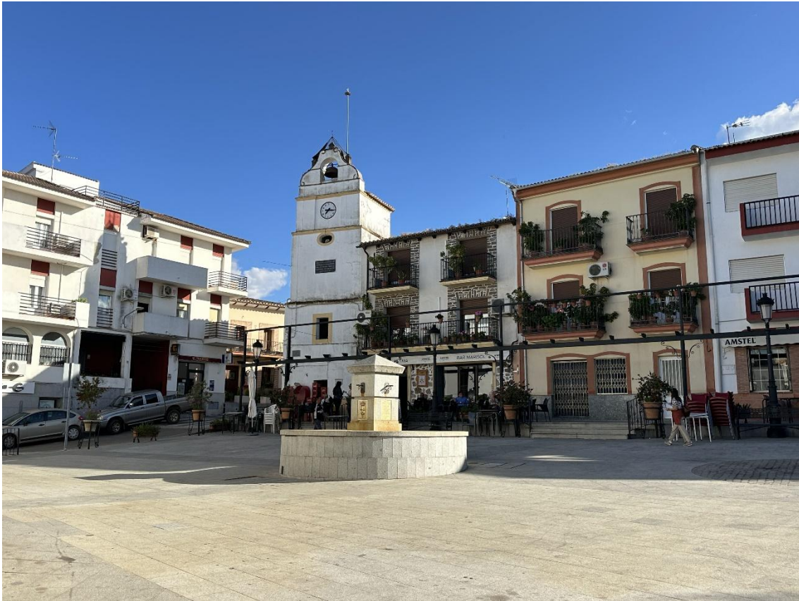
Plaza de España, con la fuente en primer término y al fondo “El Reloj”.