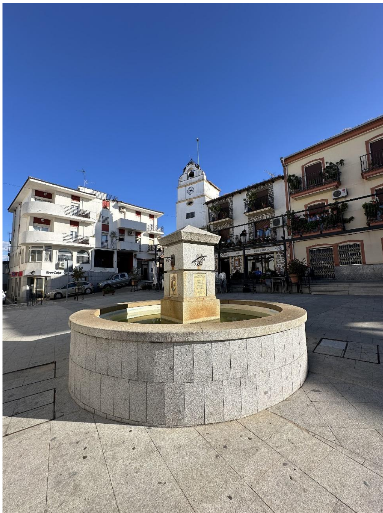
Fuente en la Plaza de España de Valdecaballeros.