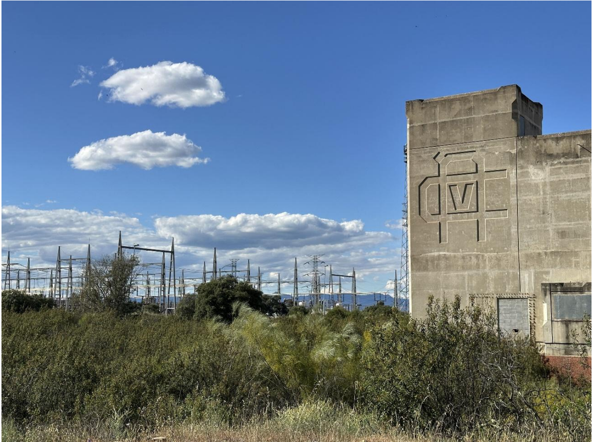
Imagen del edificio que iba a albergar la unidad II. Al fondo, subestación eléctrica que abastece al municipio.