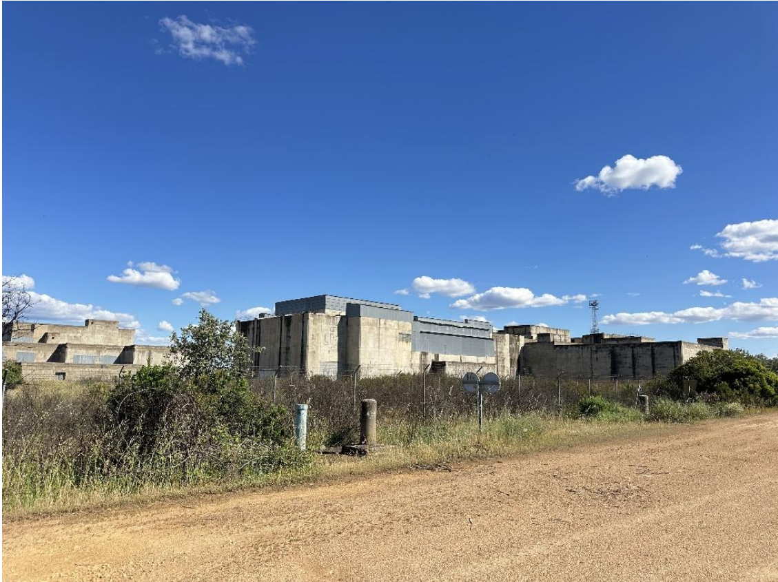
Arriba, vista general de los edificios. Abajo, logotipo de la central nuclear marcado en el hormigón.