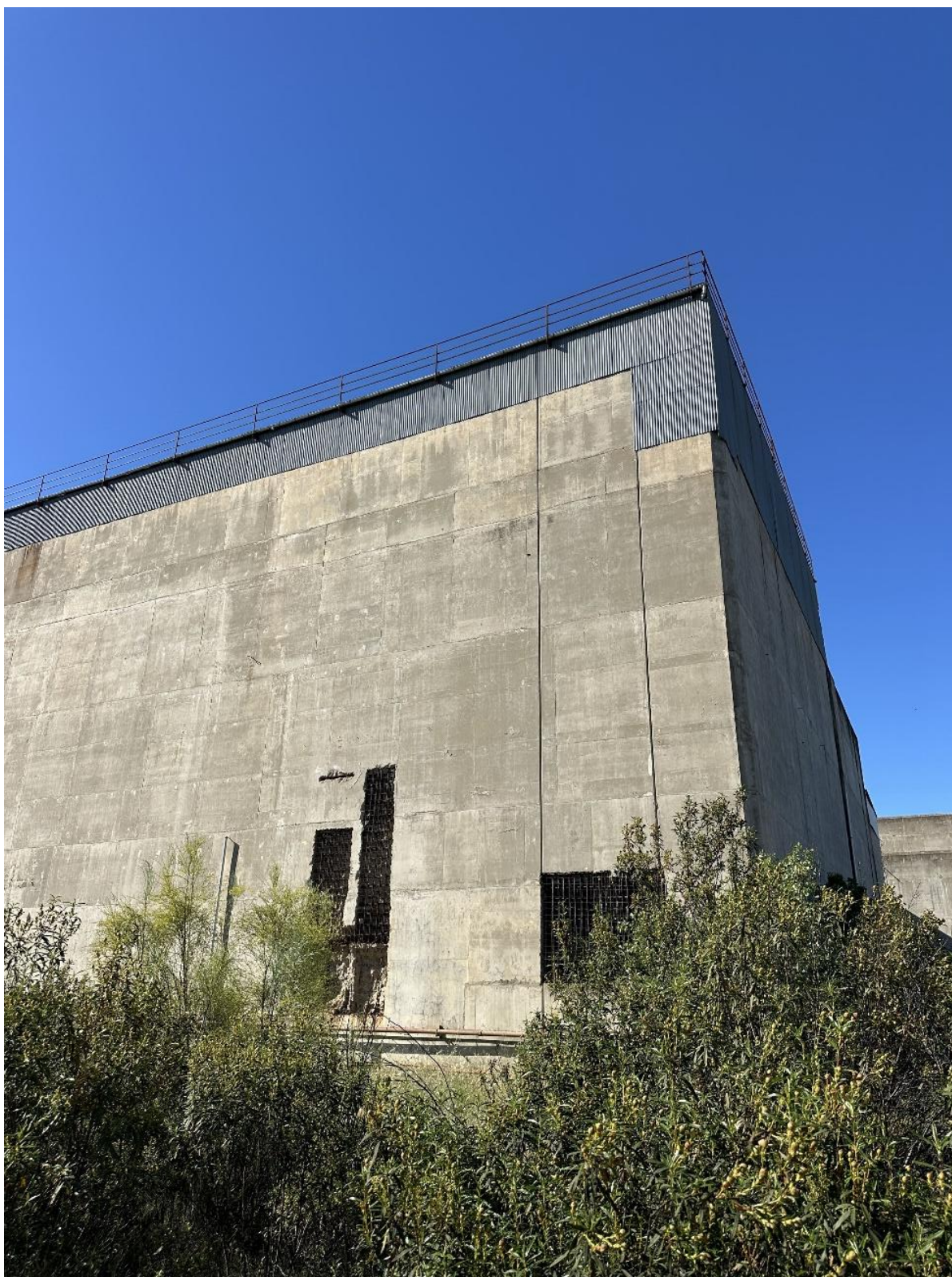
Quedades que demuestran los intentos realizados para demoler las instalaciones.