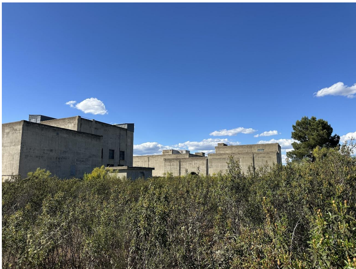
La vegetación se ha apoderado de la mayor parte del recinto.