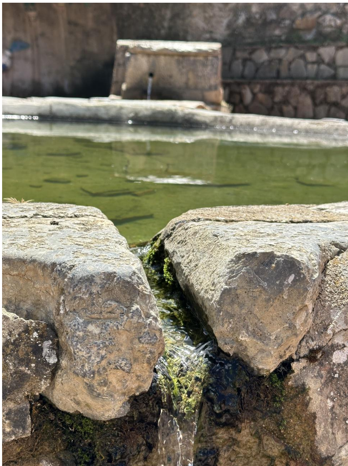
La fuente responde a una tipología sencilla, propia de las fuentes tradicionales rurales.