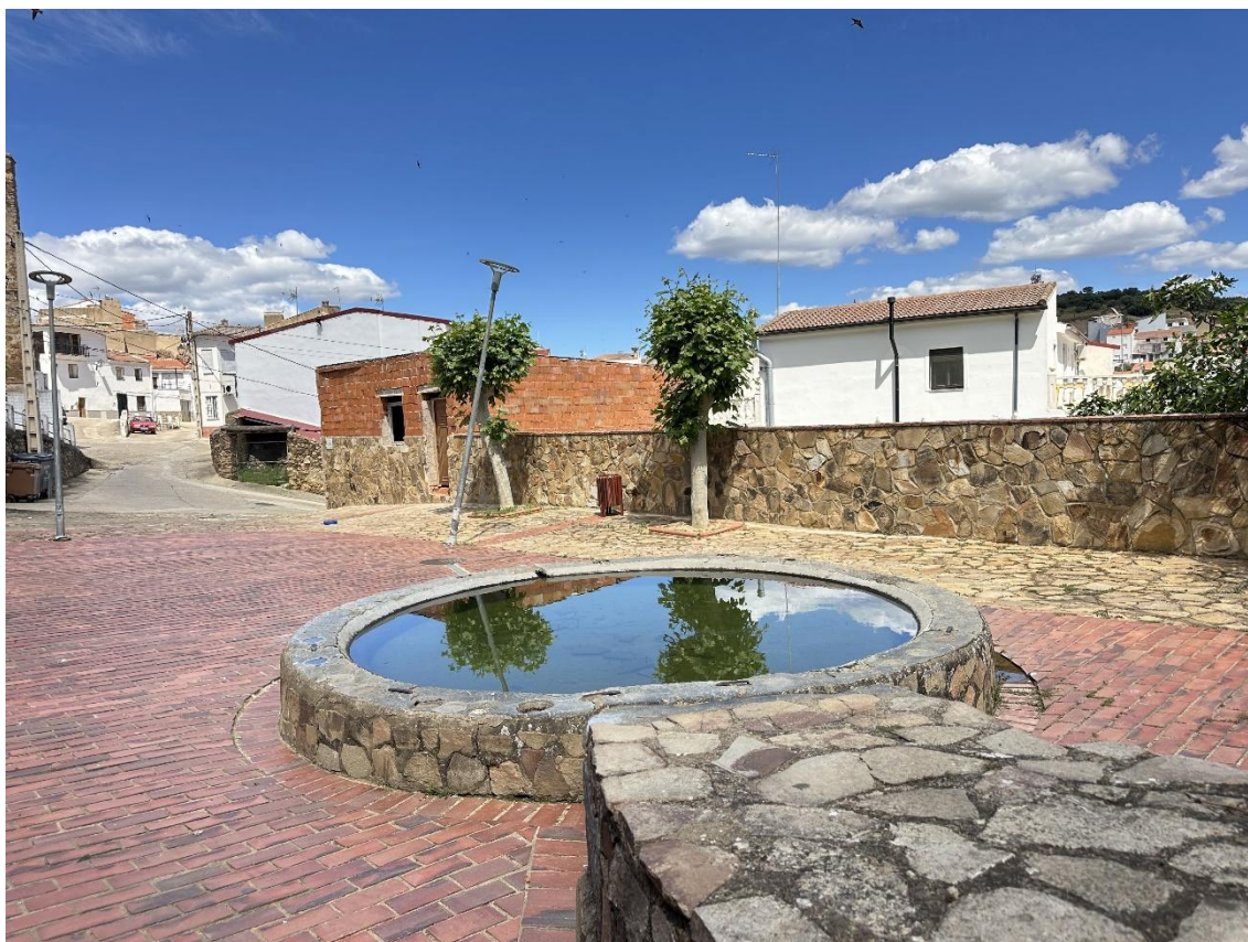
Imagen de la Fuente "El Chorro viejo", centro de reunión de los vecinos.