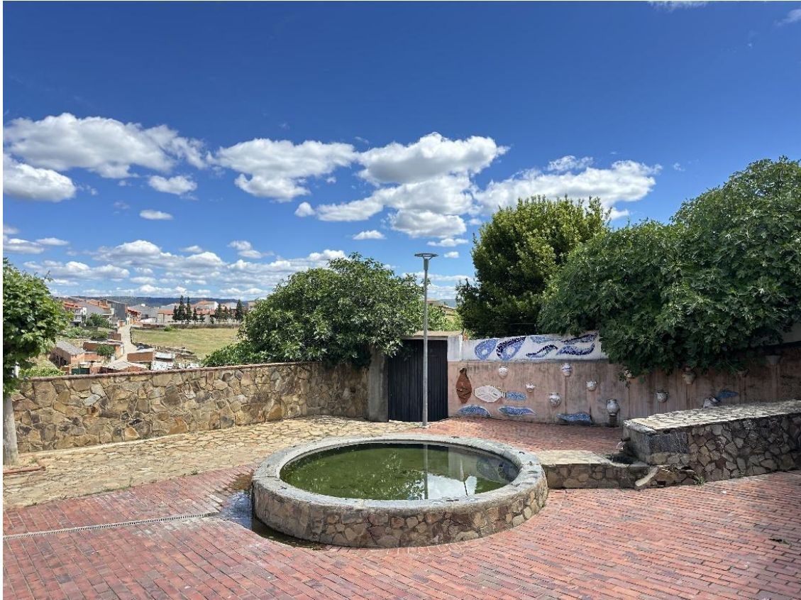
Distintas imágenes de la fuente, muy próxima a la iglesia parroquial.