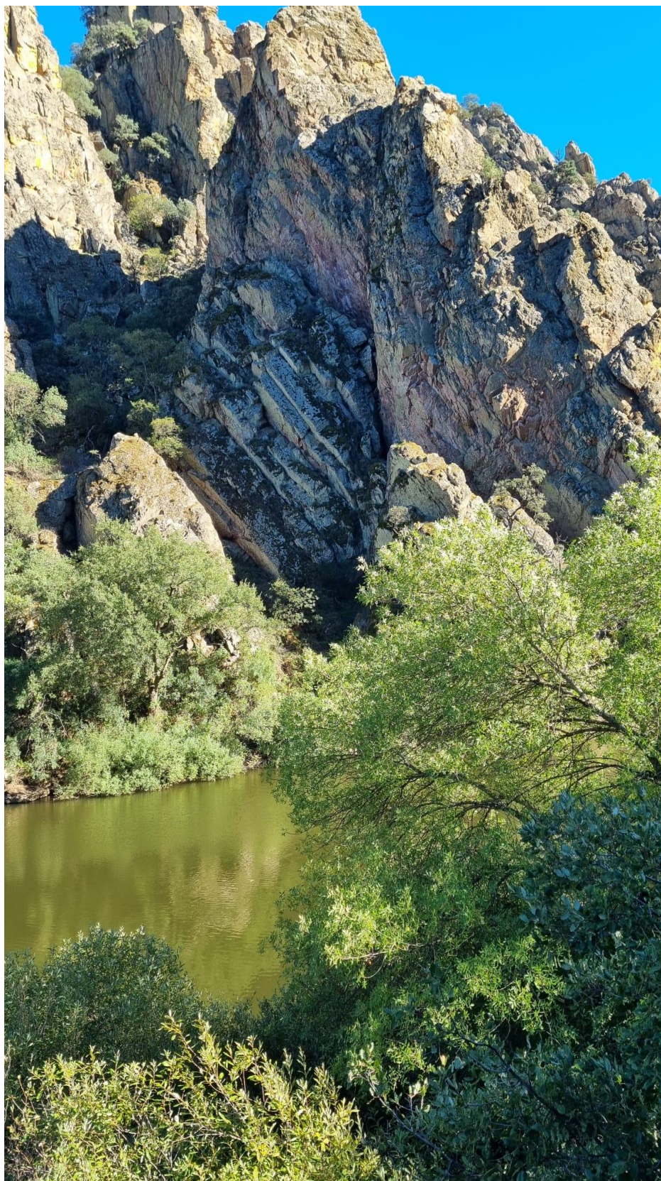
El río serpentea entre las rocas dibujando un paisaje excepcional.