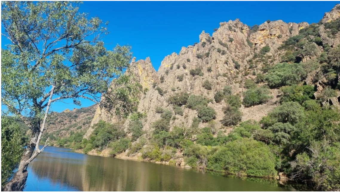
Dos imágenes que muestran el paisaje que se esconde en Las Hoces del Guadiana en Villarta de los Montes.