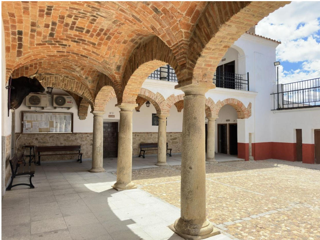
Vanos con dinteles de cantería en el patio interior.