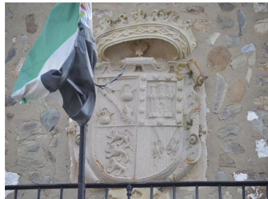
Vista del patio del ayuntamiento y detalle del escudo granítico blasonado que preside la fachada del edificio.