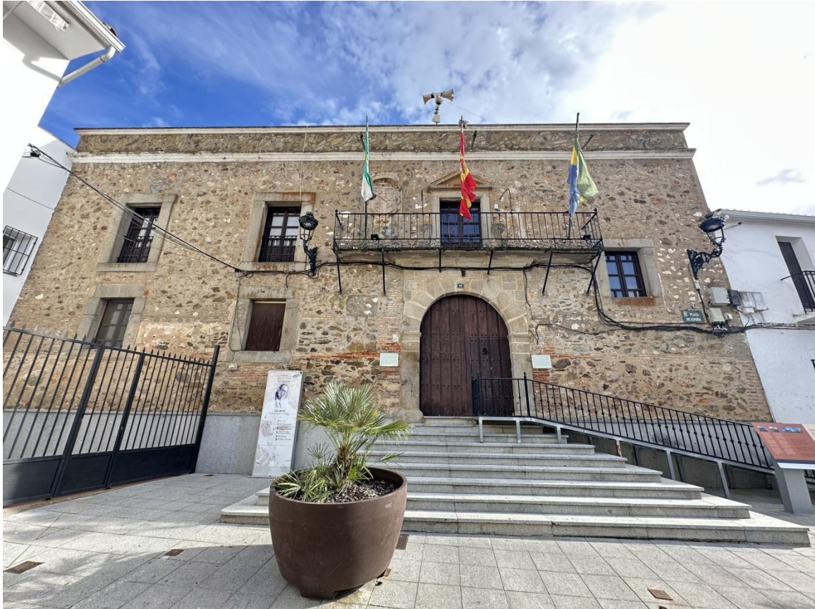
Fachada del ayuntamiento, fuente de la plaza y vista general desde un arco.